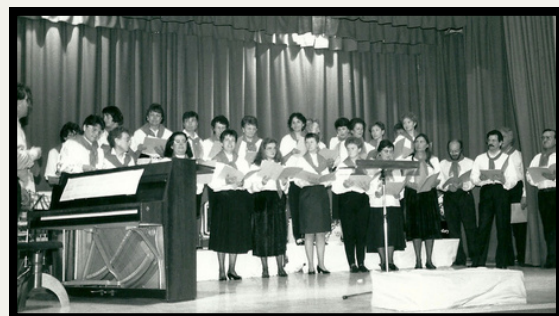
Le panneau qui présente la partie musicale du jumelage entre SAO BRAS DE ALPORTEL et ROCHE LA MOLIÈRE.